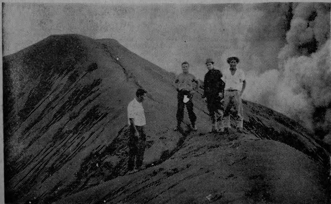
INDIOS Y ACOMPAÑANTES.— En medio de la gris desolación del Volcán los Súkiás indios de Chirripó y acompañantes de Bienestar Social mientras se acercaban al cráter.

¿Qué elementos en Costa Rica facilitan el crecimiento de la parasitosis?